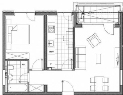
Localizare apartament 2 camere tip X7 pe etaj, în Bloc 1